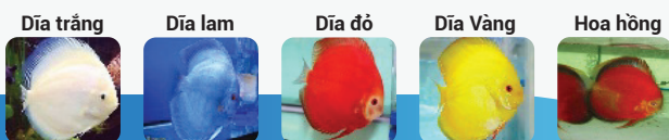
Dòng xanh (bông đứng, bông thường, da rắn, chỉ đỏ,...); nâu đỏ, nâu vàng (dòng bông đầu, bông cờ) và dòng một màu: Trắng, lam, đỏ, vàng, hoa hồng, tuyệt đỏ, tuyệt vàng)

+ Dòng đặc biệt, đột biến: thân ngắn (bull), cò cao (highbody), mắt đỏ (albino), nhập nội (Singapore, Malaysia,...)