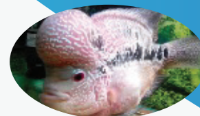
Dòng La Hán King Kamfa