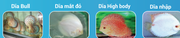
Dòng cá Dĩa đặc biệt, đột biến