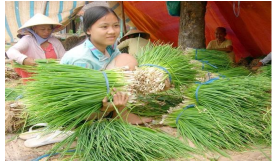
Nông dân miền Tây thu hoạch hành lá để bán cho thương lái thu mua chế biến.

Đến nay, Tổ công tác của Bộ NN-PTNT đã giúp kết nối tiêu thụ lượng nông sản đáng kể tại Nam bộ và Tây Nguyên. Nhu cầu thu gom, thu mua nông sản để chế biến xuất khẩu của các doanh nghiệp đang gia tăng, nhất là đáp ứng thị trường cuối năm. Chỉ trong 1 ngày, Tổ công tác đã kết nối được 46 đơn hàng cho nông thủy hải sản tại ĐBSCL. Đặc biệt, có đơn hàng đang cần mua khoảng 500 tấn rau củ và Tổ công tác đang liên kết với các tỉnh để bắt đầu triển khai từ ngày 23-8.