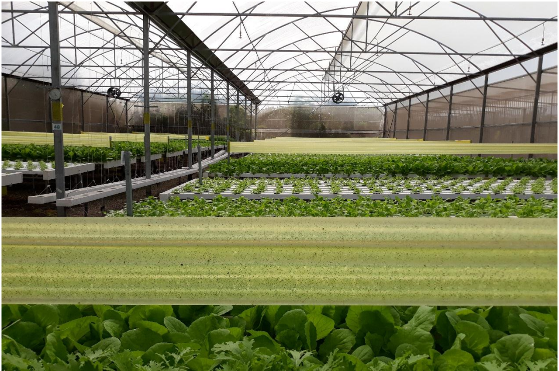
Hình ảnh mô hình rau ăn lá áp dụng công nghệ cao