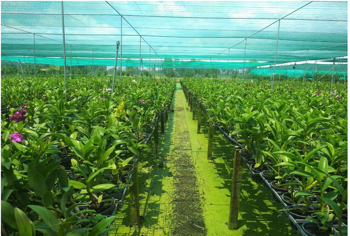
Hình ảnh Mô hình trồng hoa lan Dendrobium