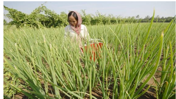
Các vùng sản xuất nông sản ở miền Tây đang chờ kết nối thị trường, hỗ trợ tiêu thụ trong bối cảnh giãn cách xã hội.

Theo Thứ trưởng Trần Thanh Nam, rút kinh nghiệm từ việc kết nối thu mua nông sản để thực hiện chương trình tặng 15.000 phần quà cho công nhân lao động của các tỉnh, thành phố đang lưu trú tại TPHCM, Tổ công tác 970 của Bộ NN-PTNT đã thí điểm “gói combo” kết hợp 5 loại nông sản với tổng trọng lượng 10kg/túi (đồng giá 100.000 đồng/túi) để đưa tới người tiêu dùng tại TPHCM.