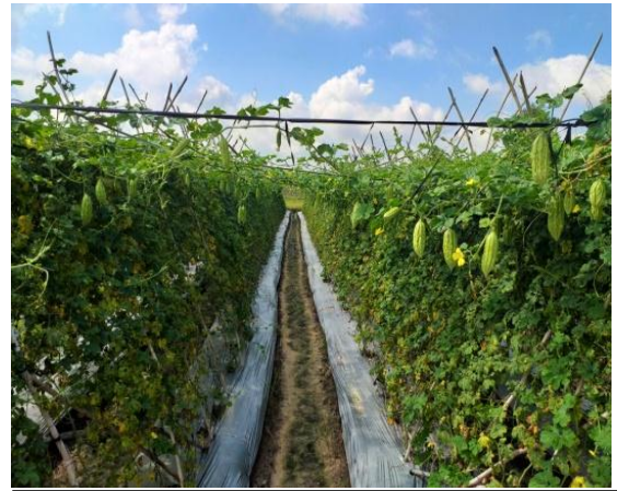
Mô hình rau ăn quả tại huyện Củ Chi, TP.HCM

Thứ sáu , khuyến nông, đào tạo nguồn nhân lực phục vụ chế biến, bảo quản rau quả. Trong đó, xây dựng triển khai thực hiện các nhiệm vụ khuyến nông phát triển sản xuất rau quả; xây dựng các mô hình sản xuất nguyên liệu rau quả phục vụ