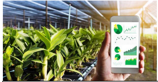
Ảnh minh họa – Nguồn Internet

Xây dựng các mô hình chăn nuôi bò sữa công nghệ cao. Trong đó quản lý đàn bò sữa thông qua chip điện tử để theo dõi tình trạng sức