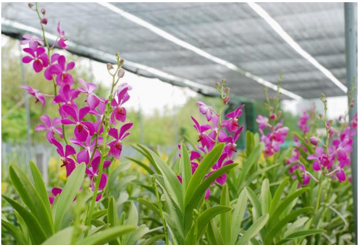
Hình ảnh Mô hình trồng hoa lan Mokara