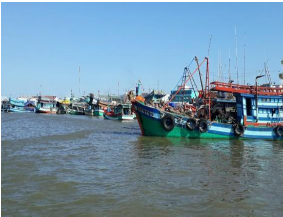
Do hoạt động không hiệu quả nên nhiều tàu cá ở ĐBSCL phải nằm bờ

Hiện nay, nhiều địa phương ở ĐBSCL đang thực hiện giãn cách xã hội theo Chỉ thị 16 của Thủ tướng Chính phủ, vì vậy việc thu mua mặt hàng thủy hải sản gặp khó, kéo giá xuống thấp, khiến nhiều tàu cá hoạt động không hiệu quả. Bên cạnh đó, ngư trường ngày càng cạn kiệt, giá dầu lại ở mức cao..., vì vậy nhiều chủ tàu cá quyết định tạm ngưng ra khơi.