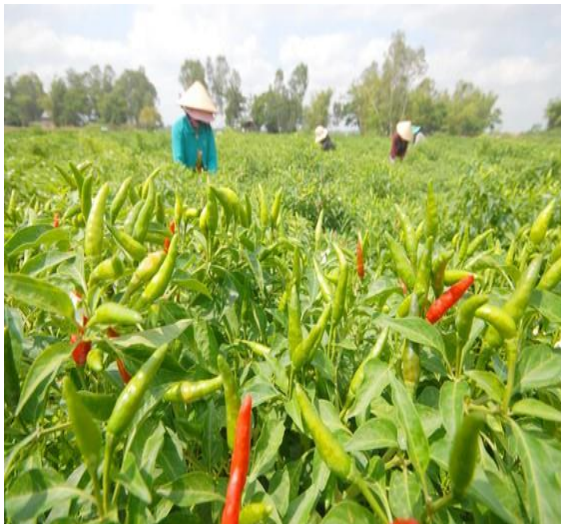
Vùng trồng ớt làm gia vị chế biến xuất khẩu tại ĐBSCL trong bối cảnh dịch Covid-19.