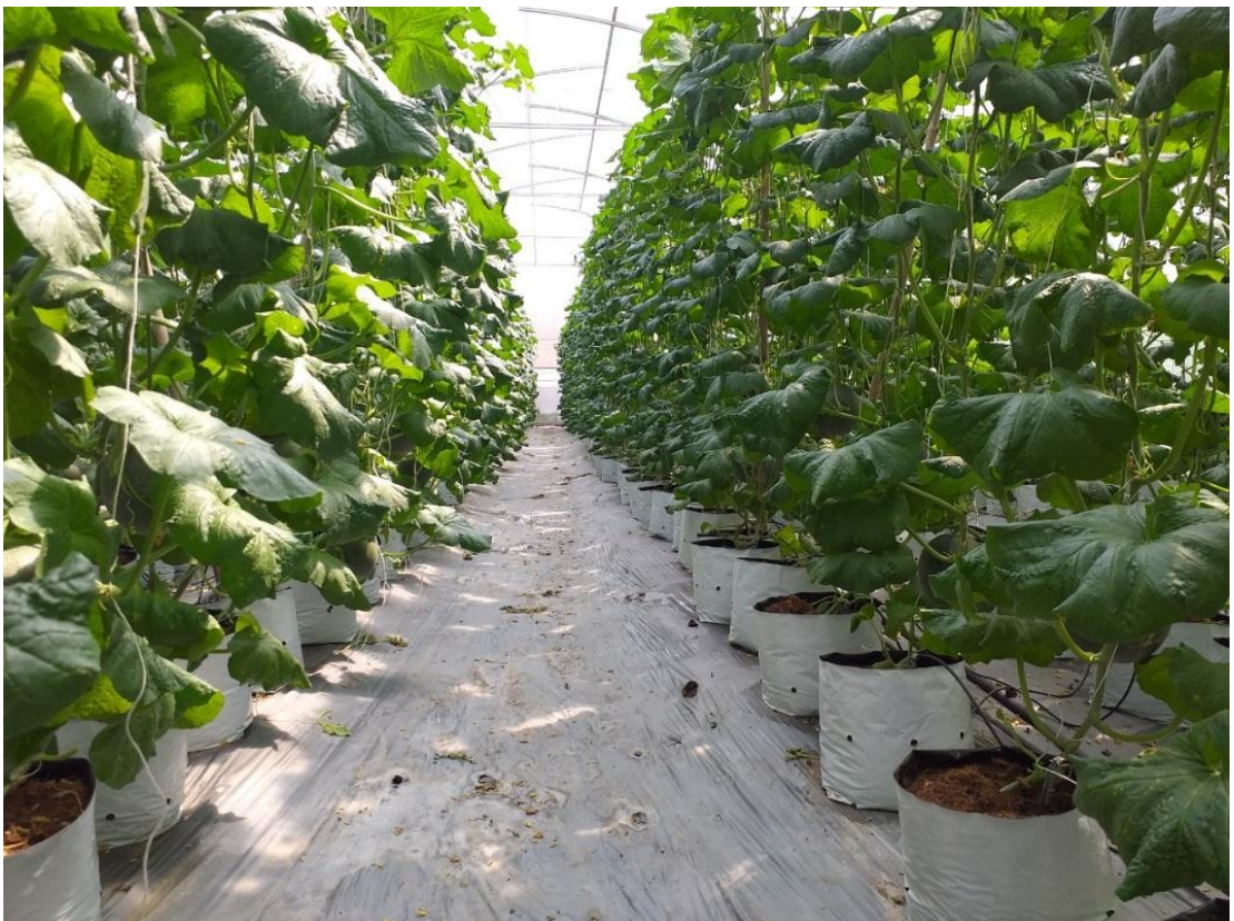
Hình ảnh mô hình trồng dưa lưới trong nhà màng