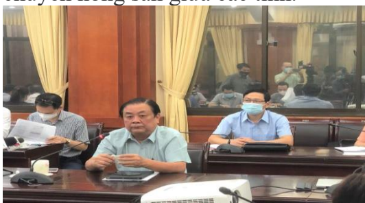
Bộ trưởng Lê Minh Hoan phát biểu tại cuộc họp

Ngày 7/6, tại Hà Nội, Bộ trưởng Bộ Nông nghiệp và Phát triển Nông thôn (NN&PTNT) Lê Minh Hoan chủ trì cuộc họp với các bộ, ngành nhằm tháo gỡ vướng mắc trong vận chuyển nông sản ra cửa khẩu và luân chuyển nông sản giữa các tỉnh.