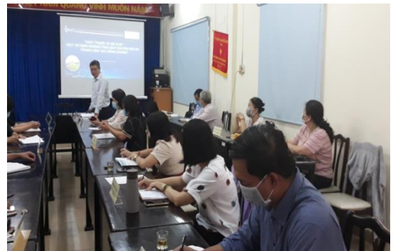
Hình ảnh buổi tập huấn nhận thức Chuyển đổi số trong ngành nông nghiệp cho các Trưởng, Phó Trạm và Phòng trực thuộc TTKN TP.HCM

Chương trình Chuyển đổi số của TP.HCM nói chung và ngành nông nghiệp Thành phố (TP) nói riêng, Trung tâm Khuyến nông (TTKN) TP đã có nhiều hoạt động về Chuyển đổi số trong ngành nông nghiệp.