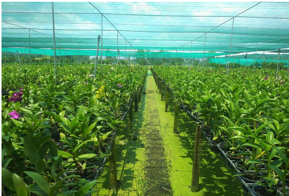
Hình ảnh Mô hình trồng hoa lan Dendrobium