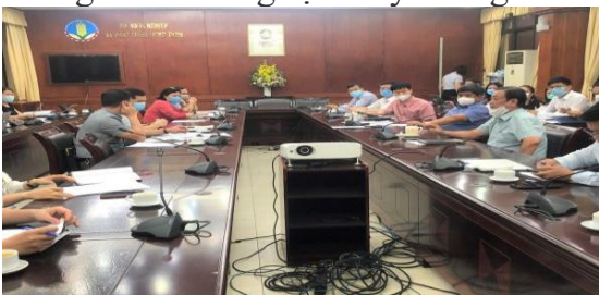
Toàn cảnh cuộc họp

phương phản ánh đã gặp nhiều khó khăn trong việc xác định nông sản trong vùng dịch an toàn khi tiêu thụ, khó khăn khi vận chuyển nông sản ra ngoài vùng dịch. Cùng với đó là những khó khăn về con người khi bị cách ly trong vùng dịch, thiếu lao động duy trì sản xuất, việc kiểm dịch của đơn vị chuyên môn tại các vùng dịch bị cách ly y tế rất khó khăn... Đồng thời việc vận chuyển, lưu thông nông sản giữa các địa phương cũng đang gặp rất nhiều trở ngại. Các chốt kiểm soát dịch bệnh COVID-19 tại các địa phương áp dụng biện pháp phòng dịch quá mức cần thiết khi không cho phép xe vận chuyển nông sản của địa phương khác đi qua, dù có giấy xác nhận an toàn dịch bệnh đối với tài xế và hàng hóa. Không chỉ vậy, các địa phương cũng phản ánh gặp nhiều khó khăn do cước phí vận tải tăng, nhu cầu thị trường giảm, chi phí nguyên vật liệu đầu vào tăng, chi phí cầu đường và lưu thông vận chuyển tăng.