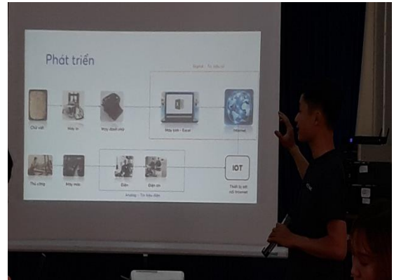
Hình ảnh giới thiệu về ứng dụng Farmnext trong Hội thảo Huấn luyện ứng dụng Chuyển đổi số ngành Thủy sản tại TTKN TP.HCM

thủy sản của ngành nông nghiệp TP. Nhưng trước đại dịch Covid-19 đang hoành hành hết sức phức tạp, thì việc triển khai nội dung tập huấn trực tiếp đến nông dân về chuyên đề Chuyển đổi số trong nông nghiệp không thể thực hiện. Do đó, thông qua buổi tập