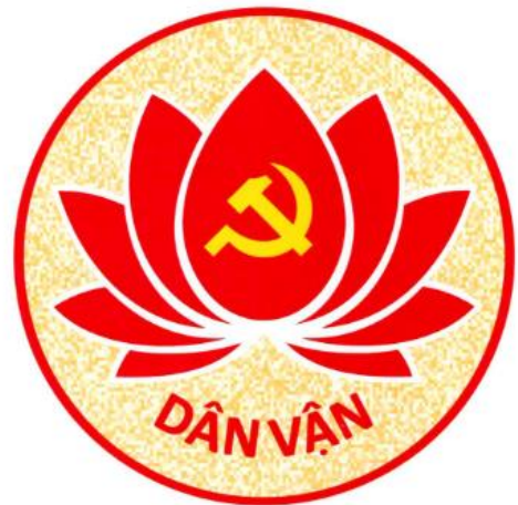
Hình ảnh minh họa

Mục đích của Hội thi nhằm giáo dục truyền thống, lòng tự hào TP.HCM vinh dự mang tên Chủ tịch Hồ Chí Minh, phát huy vai trò của hệ thống chính trị có trách nhiệm với nhân dân, chăm lo, phục vụ nhân dân; tuyên truyền hình ảnh người công chức, viên chức tham mưu tốt, dân vận khéo, góp phần xây dựng đội ngũ công chức, viên chức có đủ phẩm chất, bản lĩnh, năng lực và trình độ để