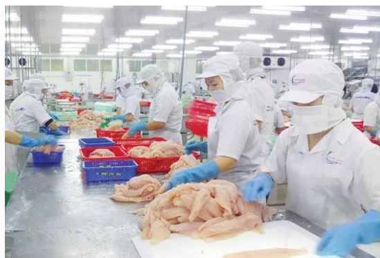
Một doanh nghiệp chế biến, xuất khẩu cá tra ở ĐBSCL.