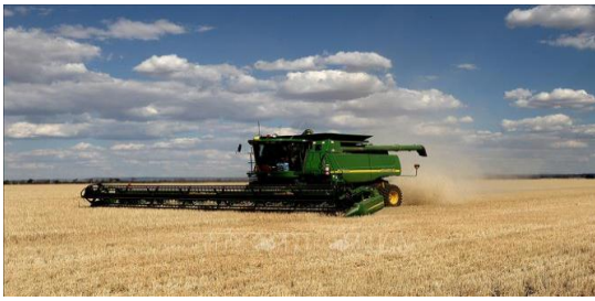
Thu hoạch lúa mạch tại New South Wales, Australia.

Dự báo thời tiết cho thấy lượng mưa sẽ ít đi tại khu vực Argentina và Nam Brazil trong ngày 16/3, và mưa trên mức thông thường ở miền Bắc Brazil. Thời tiết ẩm ướt ở Mato Grosso khiến chất lượng đậu tương và ngô bị giảm 25%. Việc thiếu ánh nắng Mặt Trời và độ ẩm đất quá cao đang làm chậm quá trình trồng ngô vụ đông của Brazil.