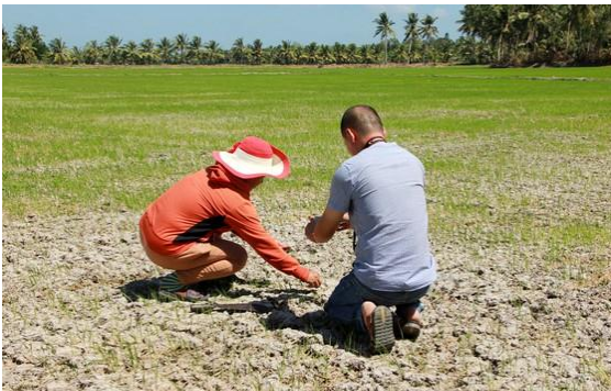
Xâm nhập mặn vào mùa khô gây thiệt hại nặng nề cho nhiều địa phương tại ĐBSCL

Viện Khoa học Thủy lợi miền Nam vừa đưa ra nhận định về tình hình hạn mặn trong mùa khô ở ĐBSCL. Theo dự báo, đến giữa tháng 3-2021, nước mặn sẽ tăng và xâm nhập sâu vào các sông ĐBSCL.