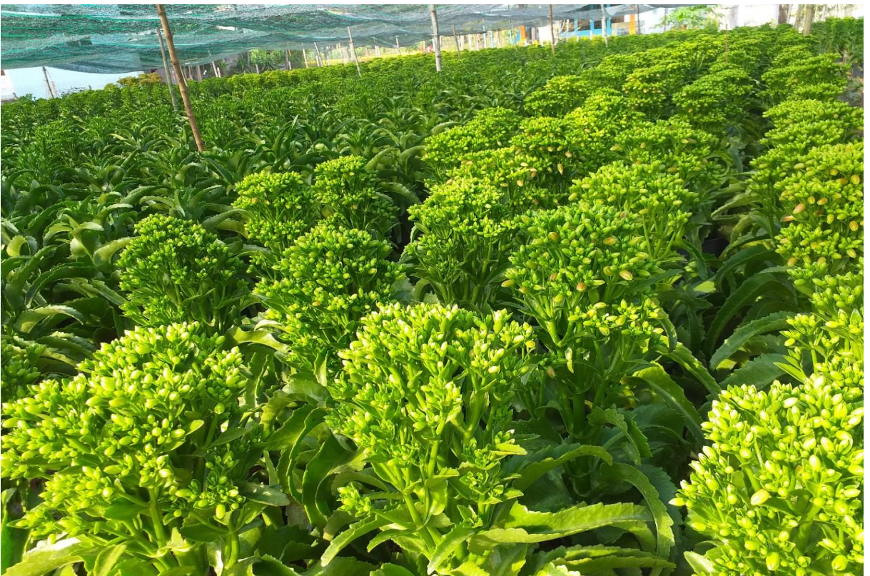
Hình ảnh hoa Tết tại Thành phố Hồ Chí Minh