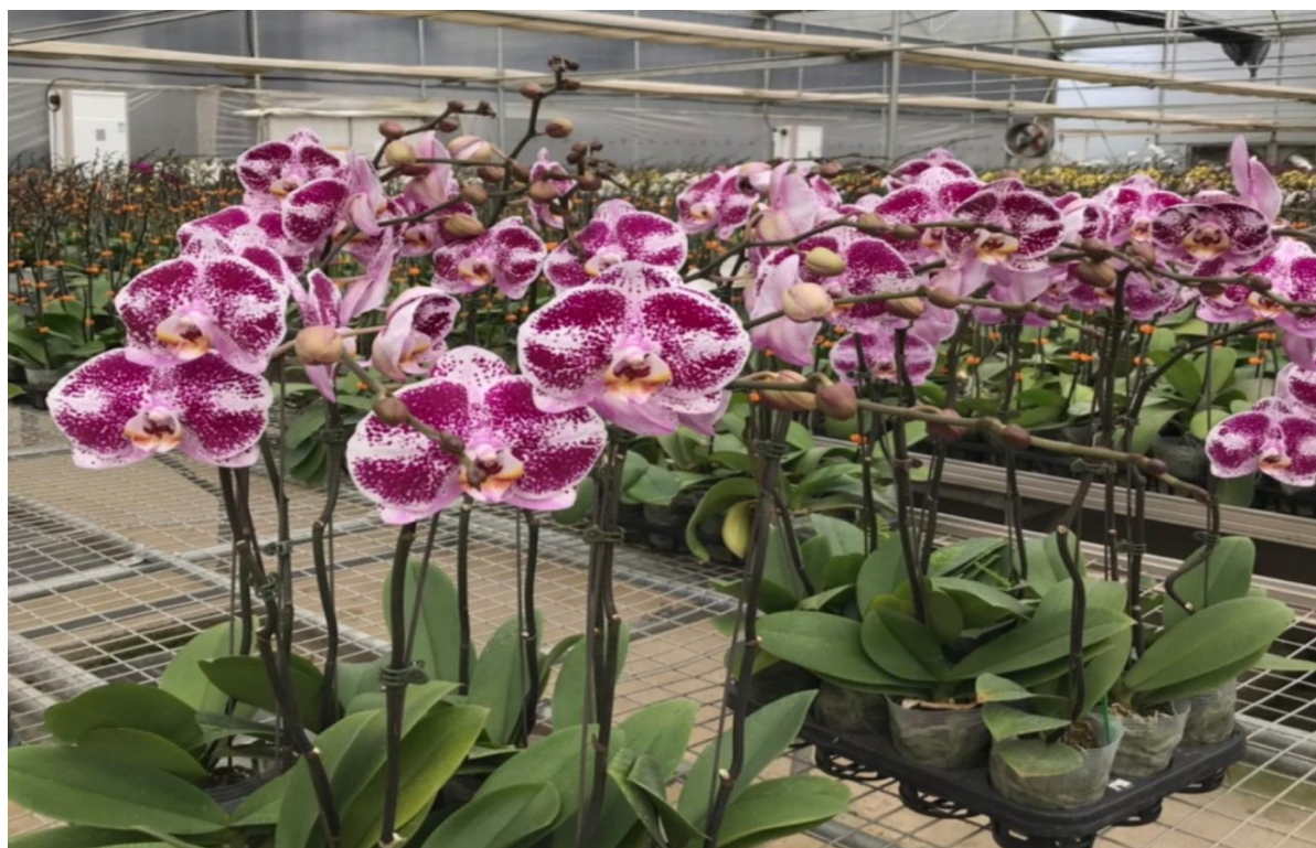
Hình ảnh hoa Tết tại Thành phố Hồ Chí Minh