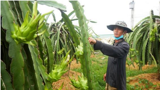
Vườn thanh long ở tỉnh Bình Thuận đã sẵn sàng phục vụ cho dịp Tết Nguyên đán sắp tới

Những ngày này, hàng ngàn hécta thanh long ở “thủ phủ” thanh long tỉnh Bình Thuận đang trong thời kỳ tạo và dưỡng trái để kịp phục vụ thị trường Tết Nguyên đán. Tuy nhiên, giá loại trái cây này vẫn đang ở mức rất thấp, thương lái cũng không dám đến các nhà vườn để đặt cọc thu mua như mọi năm, khiến người trồng thanh long như “ngồi trên đồng lửa”.