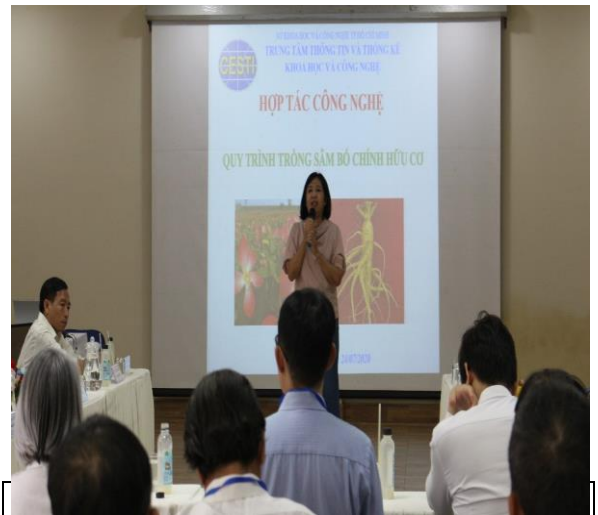
phát biểu tại hội nghị

AHRD sẽ sẵn sàng hợp tác với nhà cung ứng để hoàn thiện quy trình trồng hữu cơ và triển khai mở rộng vùng sản xuất, phát triển theo hướng áp dụng dây chuyền sản xuất công nghiệp nhưng cho ra được sản phẩm tự nhiên. Sâm bố chính chủ yếu được khai thác trong tự nhiên, gần đây mới được nghiên cứu kỹ thuật trồng và sản xuất. Kết quả "Hợp tác công nghệ" thành công nhất được ghi nhận