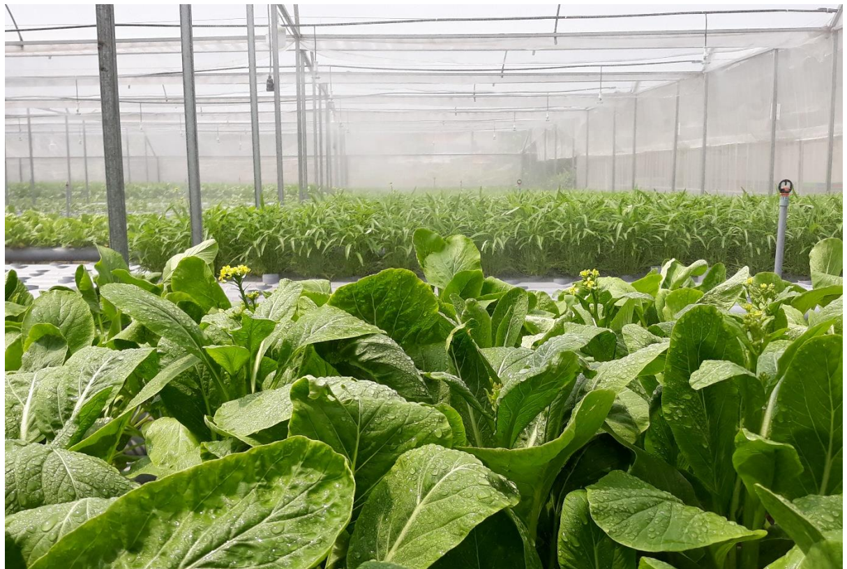
Mô hình rau áp dụng kỹ thuật công nghệ cao tại Thành phố Hồ Chí Minh