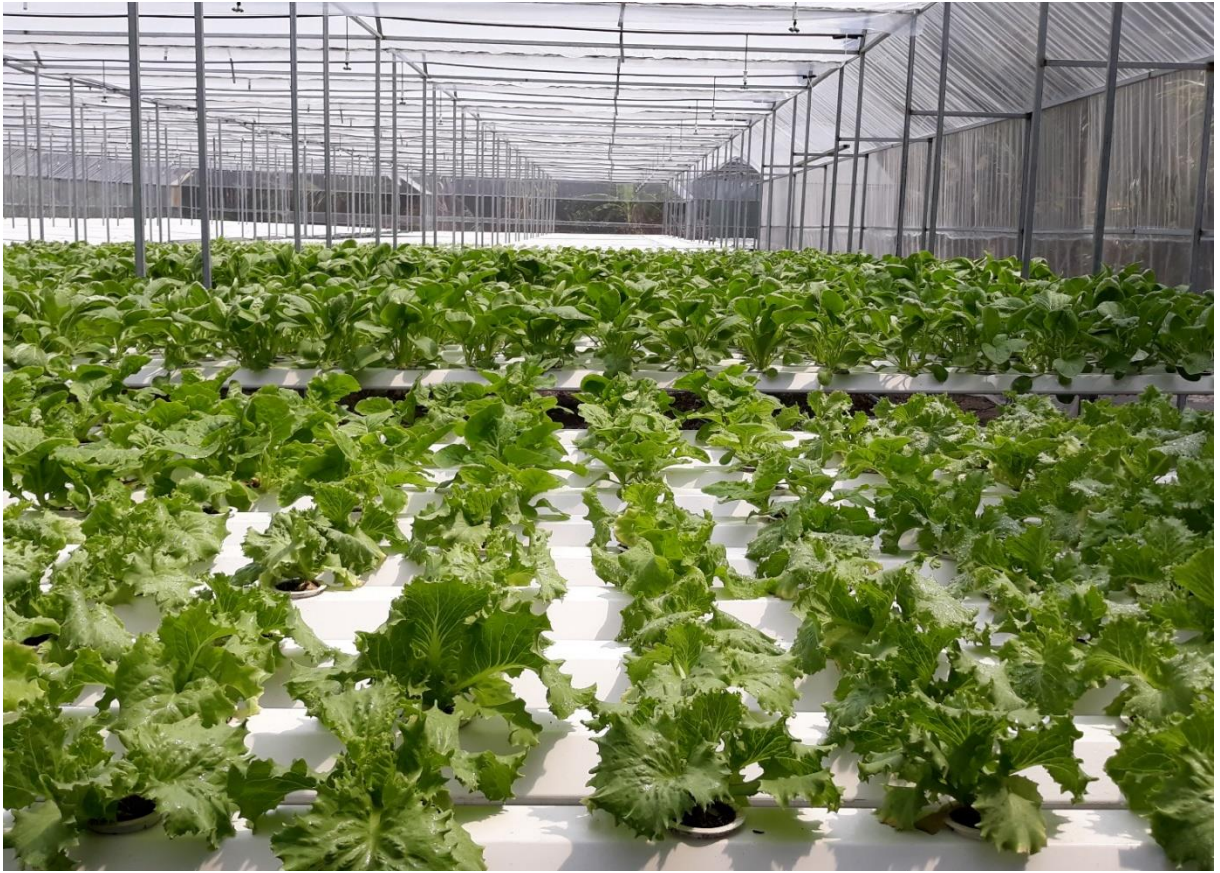
Mô hình rau áp dụng kỹ thuật công nghệ cao tại Thành phố Hồ Chí Minh