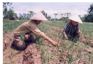
Khoảng cách trồng hành 20 x 10cm