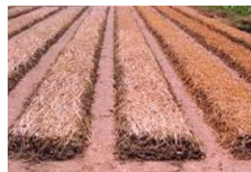
Lên liếp và tủ rơm trước khi trồng hành