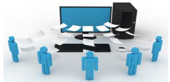
Hình ảnh minh họa

Ngoài ra, Kế hoạch cũng đưa ra tầm nhìn đến năm 2030: Người dân tiếp nhận đầy đủ thông tin thiết yếu và phản ánh thông tin về hiệu quả thực thi các chính sách, pháp luật ở cơ sở trên hệ thống thông tin cơ sở; hiện đại hóa hệ thống thông tin cơ sở để góp phần làm tốt công tác thông tin, tuyên truyền và nâng cao hiệu lực quản lý nhà nước về thông tin cơ sở.