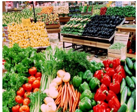
Hình ảnh minh họa

Với quan điểm phát triển ngành chế biến rau quả trở thành ngành công nghiệp sản xuất hàng hóa lớn, có khả năng cạnh tranh quốc tế cao, phù hợp với định hướng phát triển công nghiệp chế biến nông lâm thủy sản của Đảng và Nhà nước; phát triển bền vững ngành chế biến rau quả phải dựa trên nhu cầu thị trường tiêu thụ gắn với khả năng cung cấp nguyên liệu; tập trung khai thác và tận dụng các lợi thế sản xuất của từng vùng, từng địa phương; nâng cao chất lượng, hiệu quả, đảm bảo an toàn thực phẩm và năng lực cạnh tranh quốc tế trên cơ sở đẩy mạnh đầu tư phát triển các doanh nghiệp chế biến, bảo quản rau quả hiện đại; thu hút các nguồn lực của xã hội để phục vụ phát triển ngành chế biến rau quả phù hợp với đặc thù của từng địa phương thông qua các định hướng, giải pháp, cơ chế chính sách, tháo gỡ những điểm