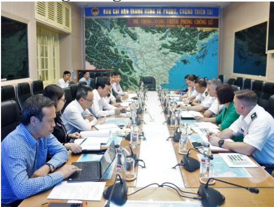
Toàn cảnh buổi họp