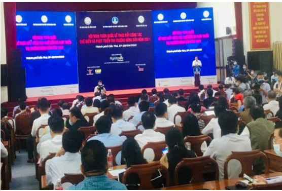
Quang cảnh hội nghị

S áng ngày 28-4, tại TP Cần Thơ đã diễn ra Hội nghị toàn quốc về "Thúc đẩy chế biến và phát triển thị trường nông sản năm 2021" do Bộ NN-PTNT tổ chức.